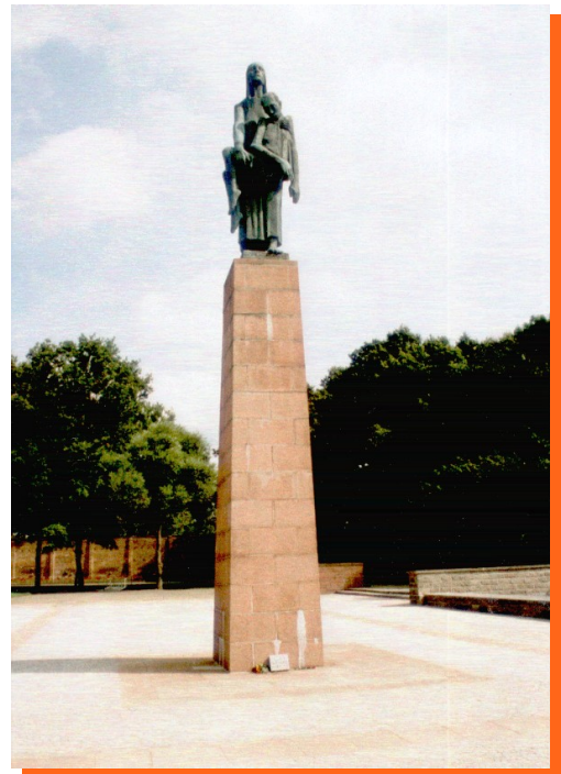
„Die Tragende“, Skulptur von Will Lammert, in Ravensbrück in unmittelbarer Nähe des ehemaligen Krematoriums