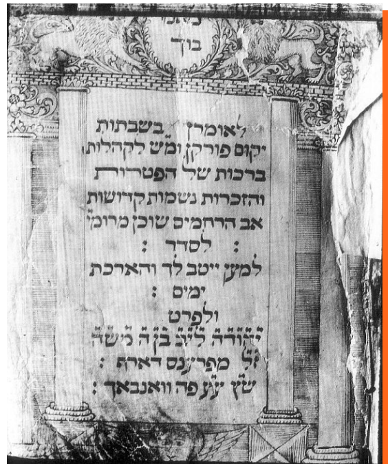
Titelblatt des Memorbuchs der jüdischen Gemeinde Wannbach (18. Jahrhundert)

Erst im 19. Jahrhundert entstand eine vielfältige jüdische Geschichtsschreibung. Mit der jüdischen Assimilation und Emanzipation ging die Suche nach ‚dem Jüdischen‘ einher und das Judentum wurde selbst Objekt historischer, jüdischer Forschung. Yerushalmi kommentiert dies folgendermaßen: